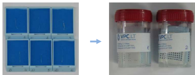
2 pav. Variantas B: Siunčiami tyrimui prostatos biopsiniai stulpeliai talpinami į atskiras histologines kasetes ar atskirus indus su fiksoviu.